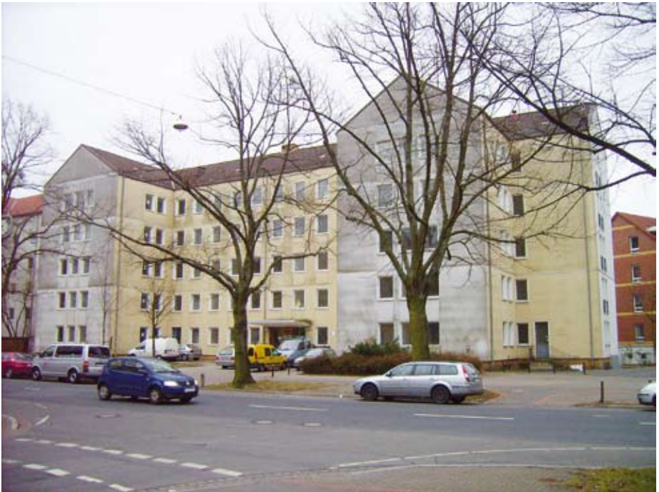
Wohnheim, Hannover, Haltenhoffstraße